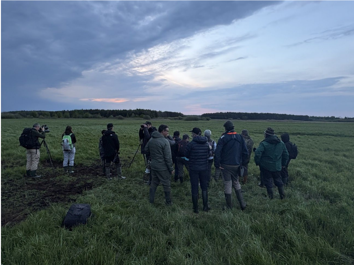
Observando las agachadizas reales en los prados de Narew