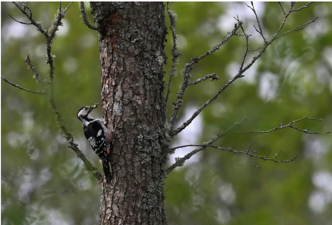
Pico dorsiblanco en el Parque Nacional de Bialowieza

Más tarde prospectamos otra zona donde aparecieron andarríos grande, dos oropéndolas europeas , mosquitero silbador , mosquitero musical , reyezuelo listado y chochín paleártico . También escuchamos papamoscas acollarado y, finalmente, pudimos disfrutar de nuestro primer pito cano , acompañado de pito dorsiblanco y picamaderos negro .