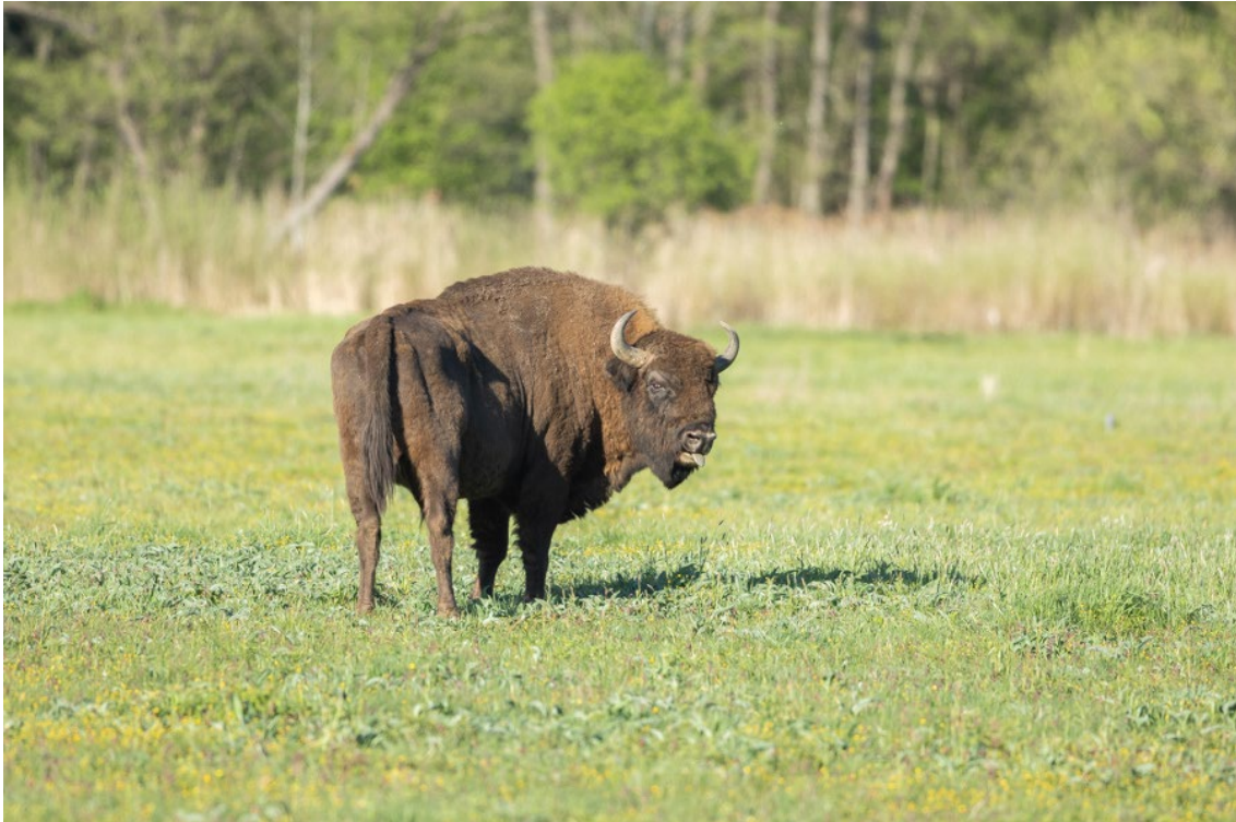
Bisonte europeo en el Parque Nacional de Bialowieza