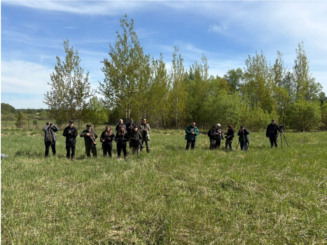
Foto del grupo por el Parque Nacional de Bialowieza

Pero aún nos aguardaban las últimas horas de la tarde, por lo que nos dirigimos hacia el lek de agachadiza real situado en los prados de Narew. Una vez allí, dejamos los vehículos y continuamos a pie entre los herbazales, observando especies como grulla común , aguilucho lagunero occidental y nuestros dos primeros pigargos europeos del viaje. También registramos buscarla pintoja y bisbita pratense , además de escuchar codorniz común y chotacabras europeo .