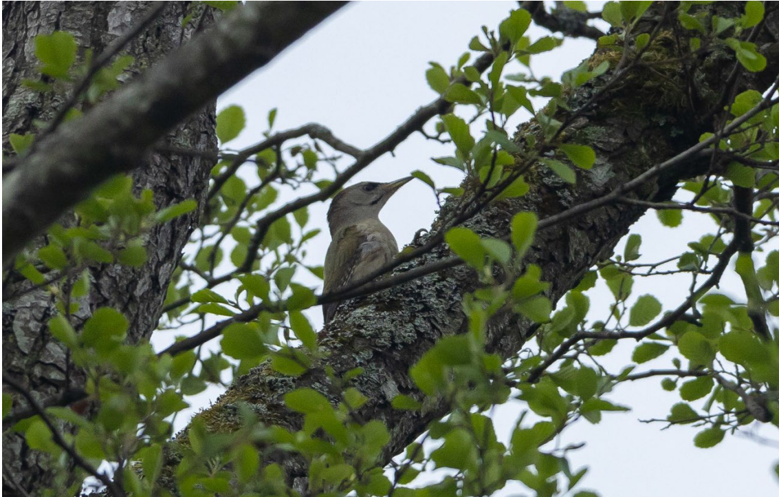
Pito cano en el Parque Nacional de Bialowieza

Tras un buen y reparador desayuno continuamos prospectando otras áreas de este increíble bosque. Durante la caminata escuchamos a muy corta distancia un grévol común , que respondió varias veces a nuestro reclamo, aunque, lamentablemente, no logramos verlo.