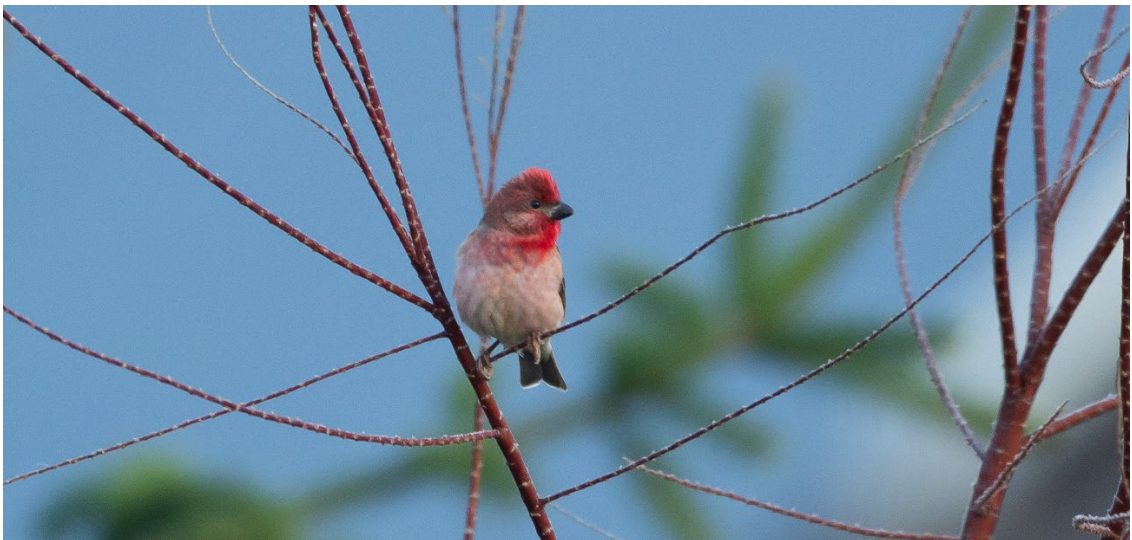
Camachuelo carminoso en el Parque Nacional de Bialowieza

desplazamos hasta Budy Bridge, donde registramos especies tan interesantes como andarríos grande , pico menor , pico mediano , carbonero palustre , carricerín común y picogordo común , entre otras muchas aves que enriquecieron la mañana.