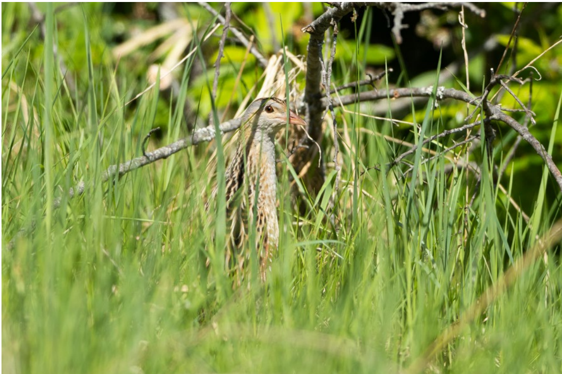
Guión de codornices en el Parque Nacional de Bialowieza

Finalmente, y contra todo pronóstico, uno de los ejemplares fue acercándose paulatinamente hasta situarse a escasos metros de nosotros, permitiéndonos disfrutar de una observación excepcional y fotografiarlo con total tranquilidad. Sin duda, este encuentro constituye uno de los momentos más memorables de todo el viaje.