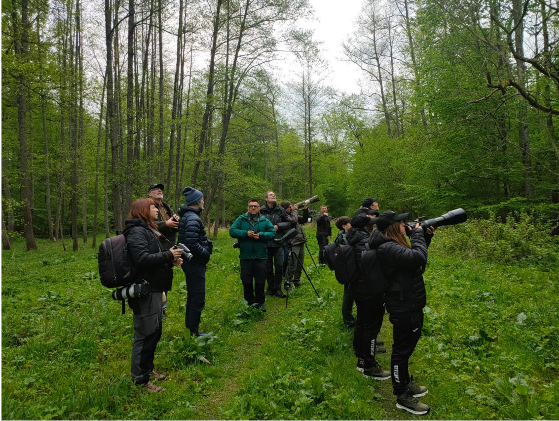
Grupo en acción por el Parque Nacional de Bialowieza

cascanueces norteño , una de las especies más emblemáticas y deseadas de todo el tour.