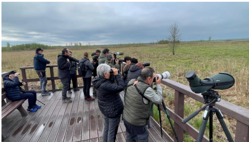
Grupo en la pasarela de Długa Luka en el PN de Biebrza

efectos de la sequía, especialmente acusada en esta región de Polonia durante los últimos años.