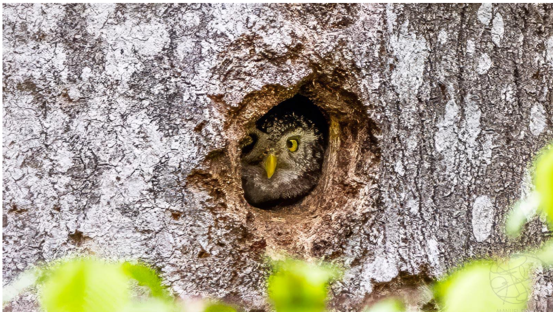
Mochuelo chico en el Parque Nacional de Bialowieza

Además, observamos gavilán común , dos cucos comunes , pico picapinos , varios picamaderos negros , cuervo grande , herrerillo capuchino , carbonero palustre , trepador azul y acentor común . Finalmente, pudimos disfrutar de un mochuelo chico asomando la cabeza desde el interior de su nido.