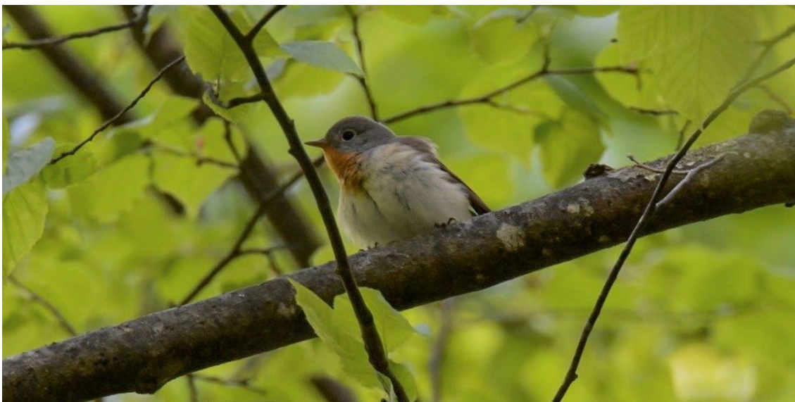
Papamoscas papirrojo en el Parque Nacional de Bialowieza