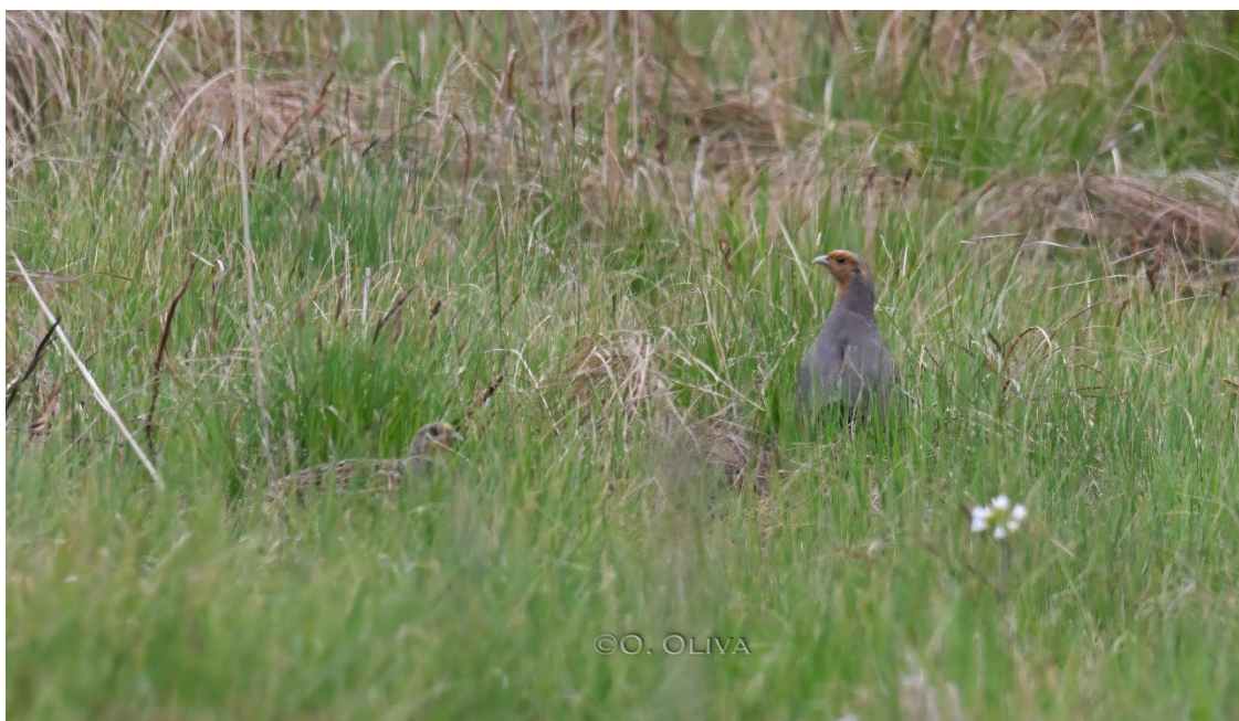
Perdiz pardilla en el PN de Biebrza

cola durante sus picados. Además, conseguimos observar a corta distancia dos perdices pardillas , así como aguilucho cenizo , buscarla pintoja , mosquitero musical , curruca zarcera , tarabilla norteña , bisbita pratense , escribano palustre y una llamativa lavandera cetrina .