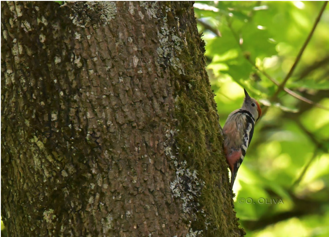
Pico mediano en el Parque Nacional de Bialowieza

También obtuvimos excelentes vistas de pico mediano , buscarla unicolor y carricero tordal . La jornada en este enclave se completó con magníficas observaciones de agateador euroasiático , ruiseñor ruso y papamoscas acollarado , entre otras muchas aves de interés.