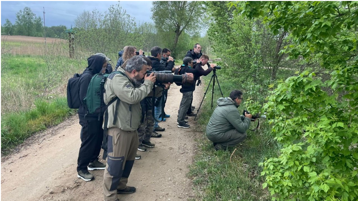
Observando el alcaudón dorsirrojo © Mireia P. Martos

Finalmente, tras instalarnos en el alojamiento, fuimos a cenar a un restaurante tan elegante como acogedor. Justo antes del anochecer pudimos escuchar nuestro primer ruiseñor ruso del viaje y observar el vuelo de dos chochas perdices sobre la zona.