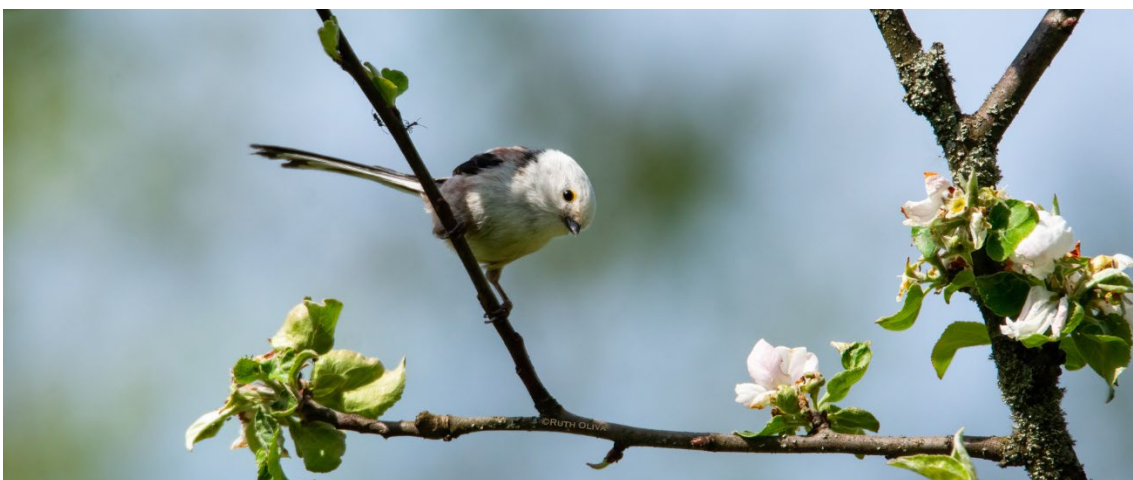
Mito común en el Parque Nacional de Bialowieza