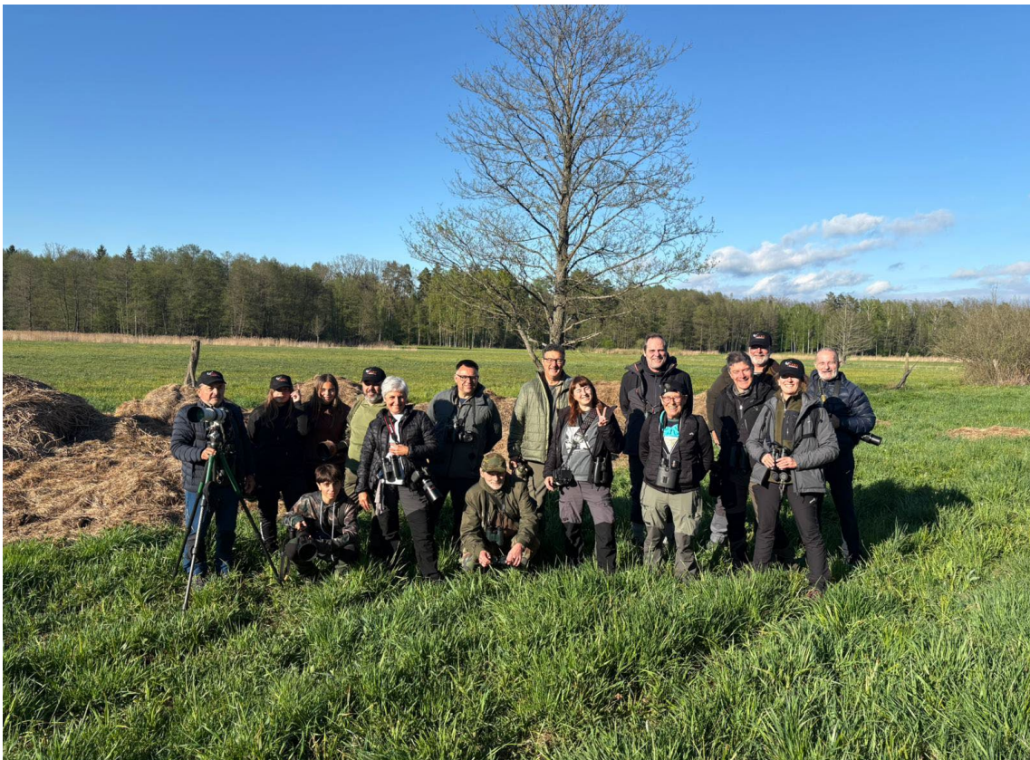
Grupo en el Parque Nacional de Bialowieza

Las tres especies más votadas por los participantes del tour fueron, en primer lugar el cascanueces norteño, el guión de codornices y, finalmente, la curruca gavilana.