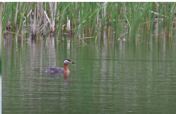
Porrón osculado y Somormujo cuellirrojo en la laguna de Dojlidy