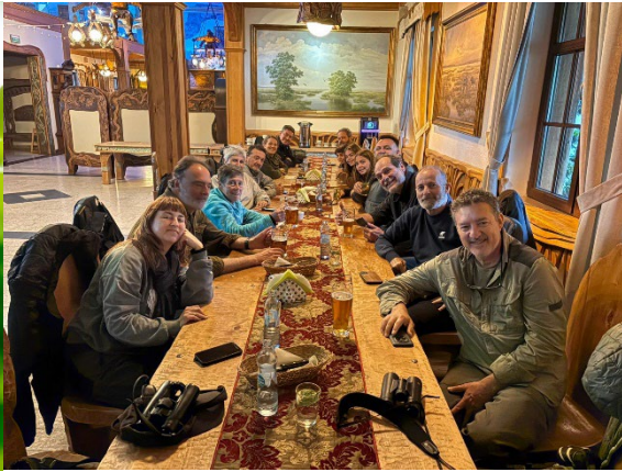
Zarcero icterino en el PN de Biebrza y foto del grupo durante la comida