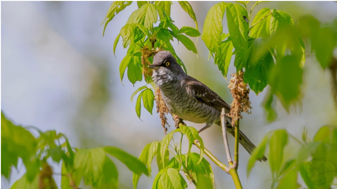
Curruca gabilana en el Parque Nacional de Bialowieza

observaciones, detectando otra águila pomerana . Más tarde, en las proximidades de la localidad de Białowieża, registramos una curruca gabilana , un busardo ratonero , una curruca zarcera y un arrendajo euroasiático , entre otras especies de interés.