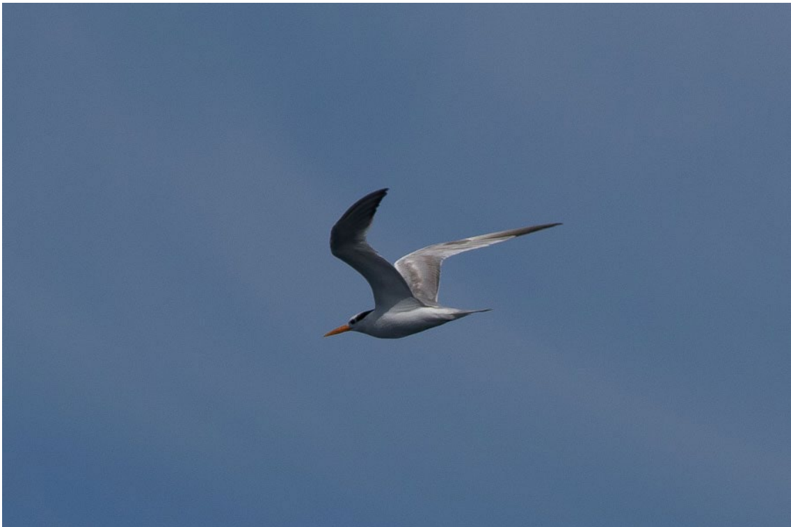
Charrán Bengalí frente Tarifa