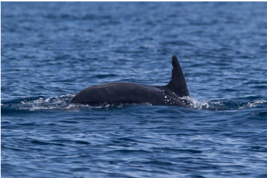
Delfín mular durante la salida pelágica