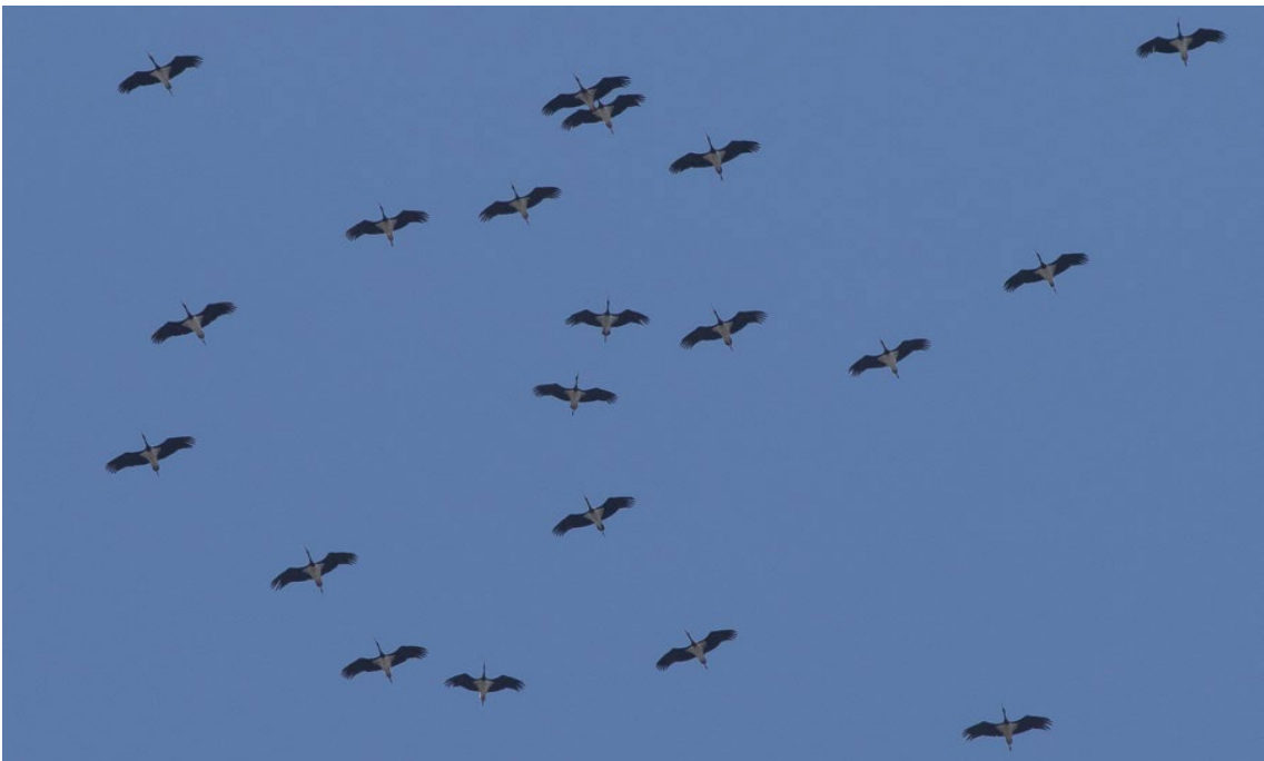
Cigüeñas Negras en paso