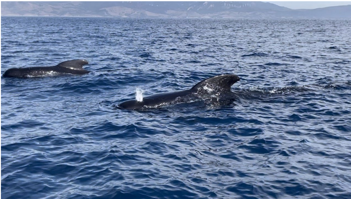
Primer grupo de calderones de nuestra salida pelágica

Mientras tanto, conseguíamos buenas observaciones de varios grupos de pardelas cenicientas y baleares que rondaban por la zona apareciendo, poco después los primeros delfines listados. Decidimos entonces dirigirnos hacia aguas marroquíes en busca de los calderones comunes y a medio camino, apareció un solitario págalo grande , un grupo de delfines mulares , varios alcatraces atlánticos y algunas gaviotas sombrías . Finalmente localizamos un primer grupo de unos seis o siete calderones que rápidamente mostraron su curiosidad hacia nuestra embarcación. Nos acercamos también a un segundo grupo con algunos ejemplares juveniles que permanecían a cierta distancia. Una verdadera experiencia a muy corta distancia que nos dejó boquiabiertos. Ya de regreso hacia el puerto de Tarifa pudimos observar nuestro único charrán bengalí del tour.