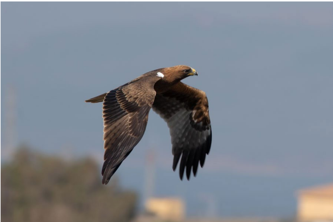
Aguila Calzada fase oscura en Tráfico