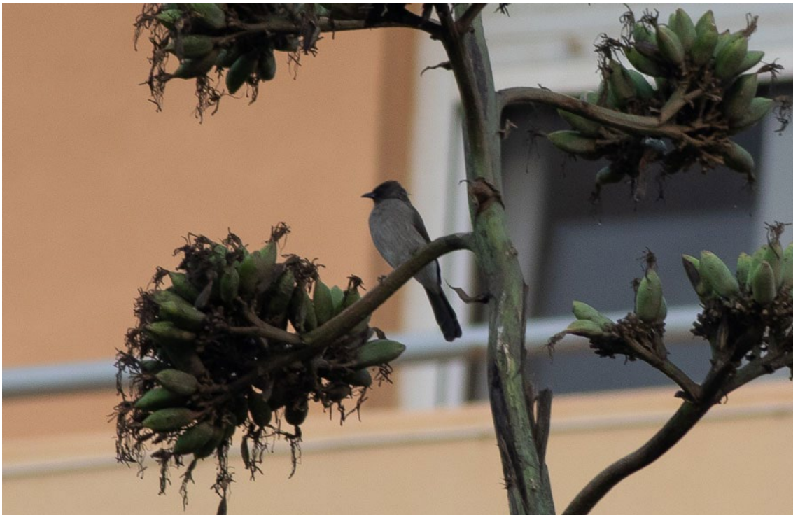
Bulbul Naranjero en Tarifa