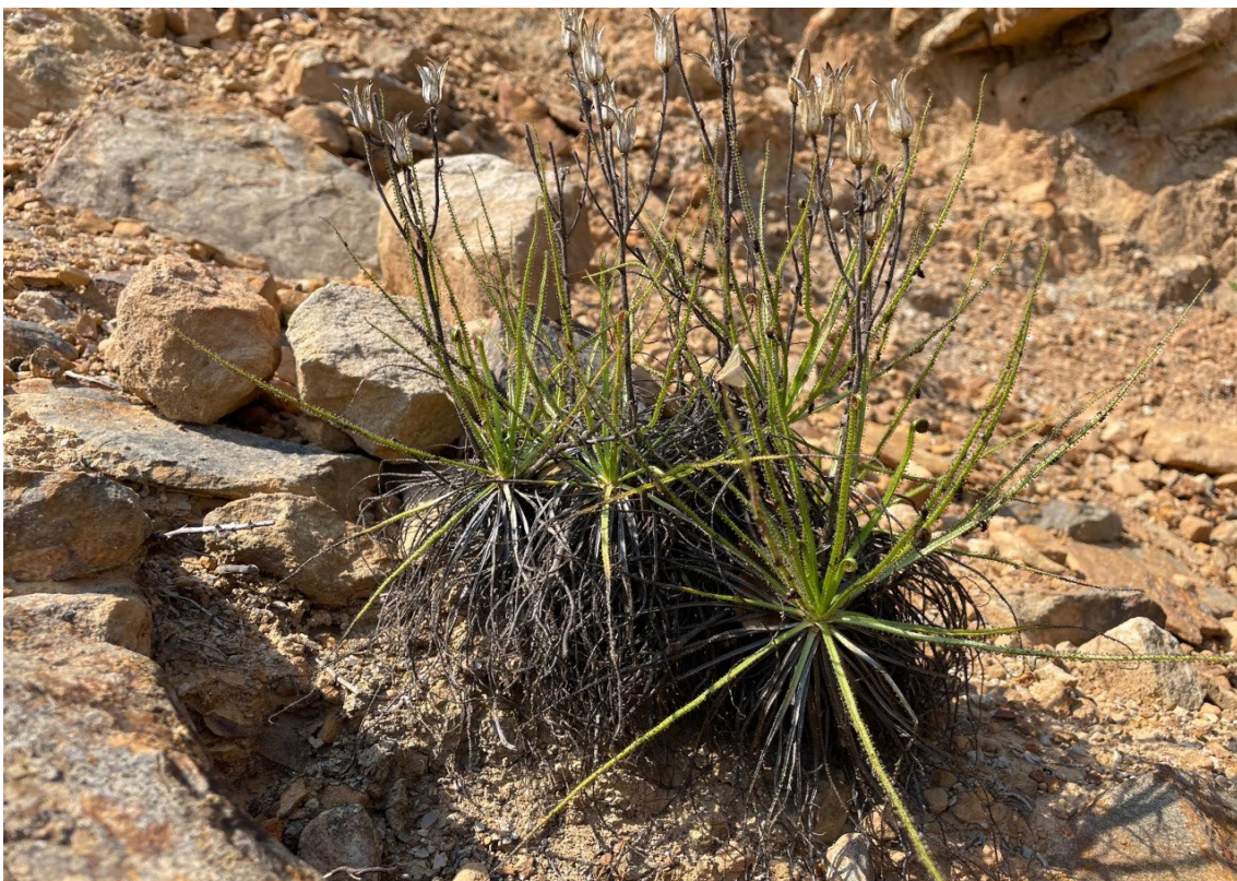
Drosera portuguesa

Aprovechando que los vientos no nos eran muy favorables, nos dirigimos de nuevo hacia Tarifa haciendo una breve interrupción para fotografiar las “atrapamoscas” o drosera portuguesa ( Drosophyllum lusitanicum ), una planta carnívora endémica del estrecho de Gibraltar muy especial.