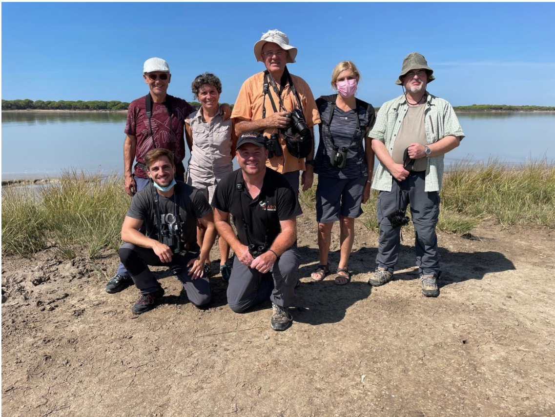
Grupo al completo en la orilla del río Guadalquivir

dirigimos hacia el aeropuerto de Málaga donde terminó nuestro tour.