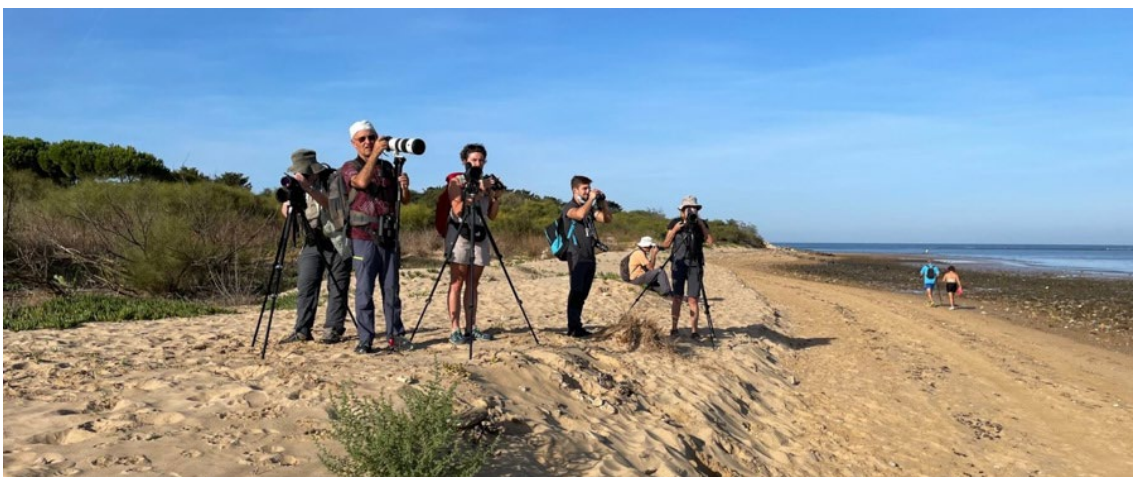
En la playa de Montijo observando el charrán elegante

Terminamos nuestra jornada buscando el vencejo cafre en uno de los puentes de la autovía A381 que pudimos ver y fotografiar nada más llegar.