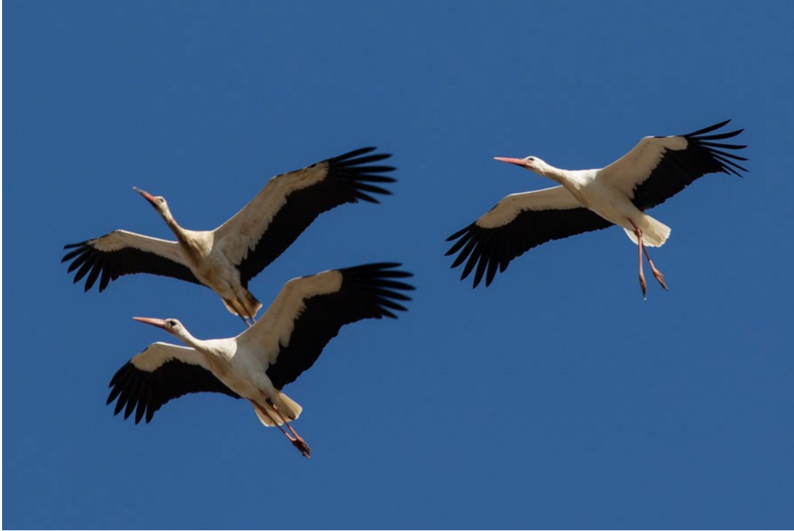
Cigüeñas Blancas en La Janda