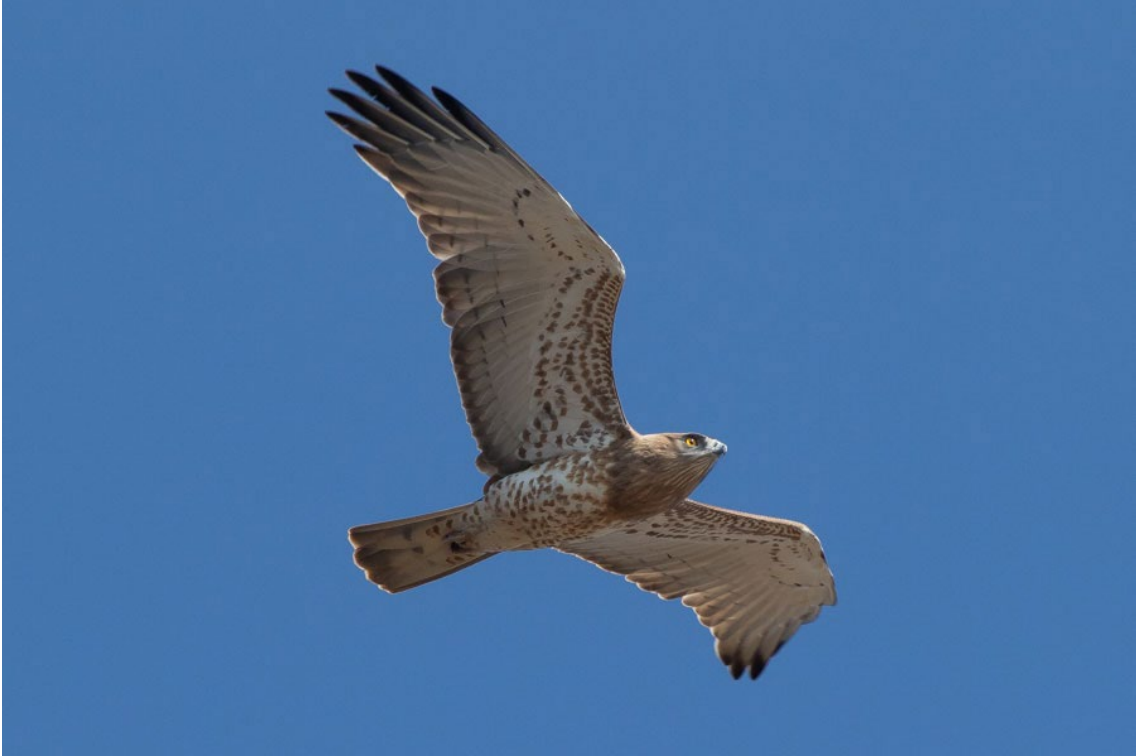
Culebrera Europea sobre Tráfico