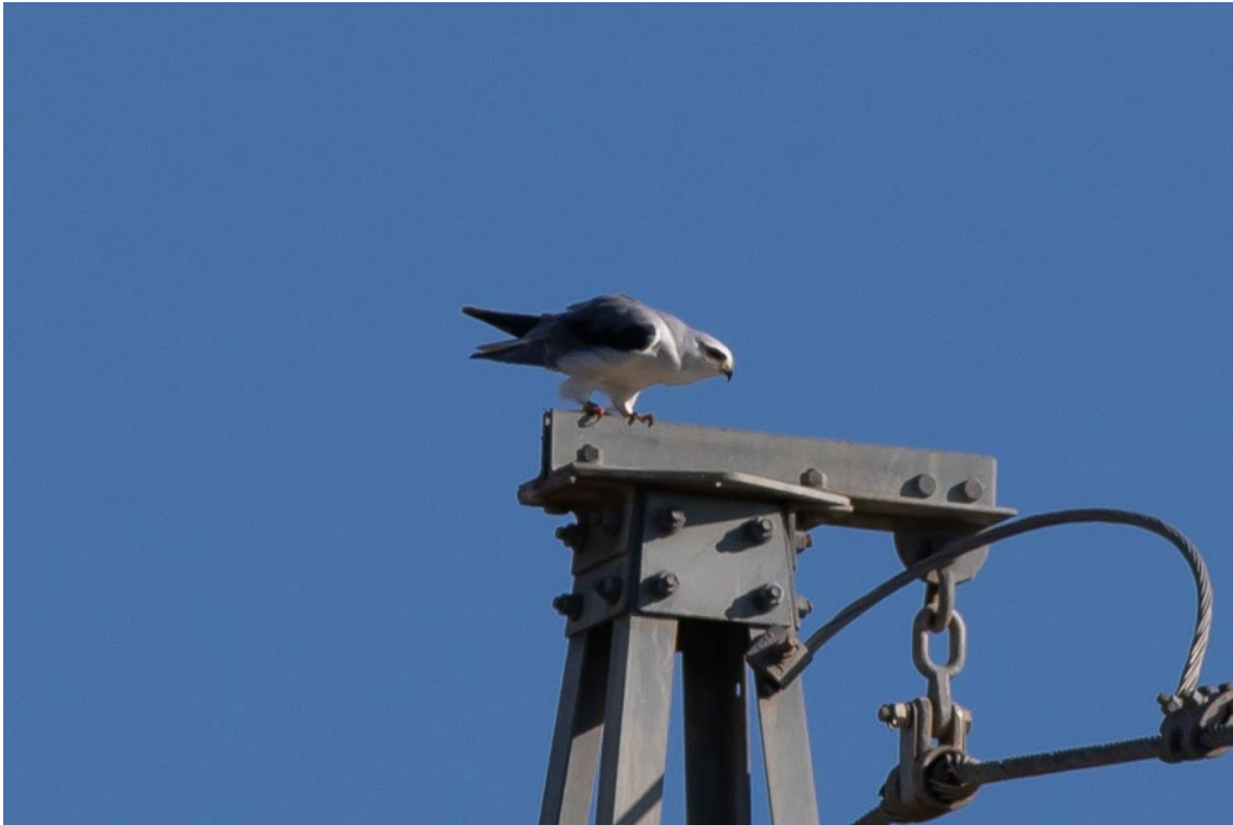
Elanio Común en La Janda