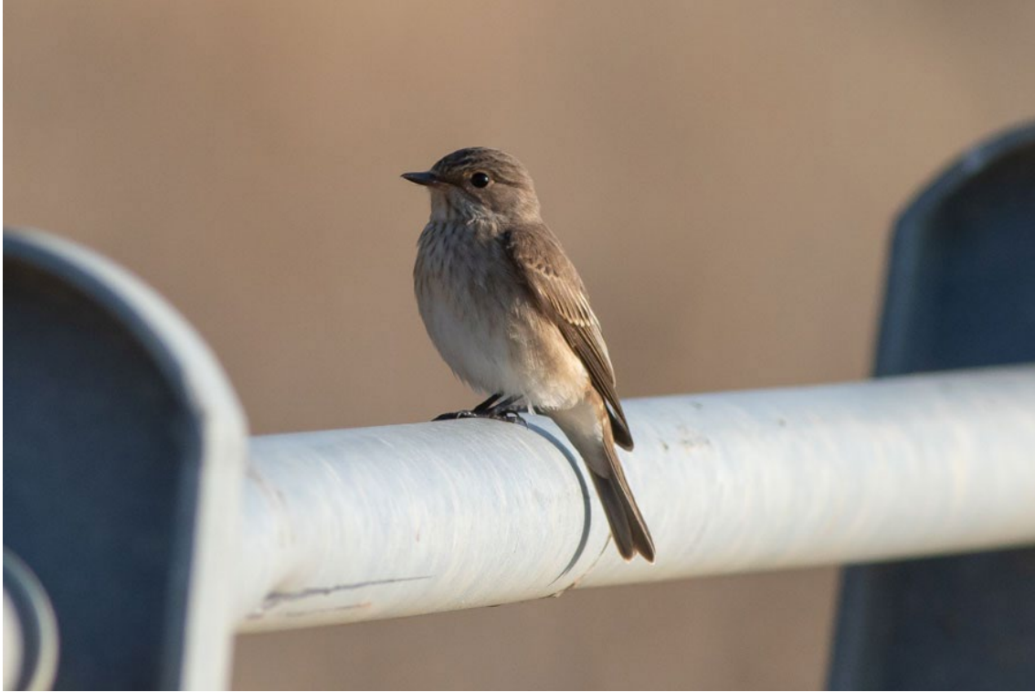
Papamoscas Gris en La Janda