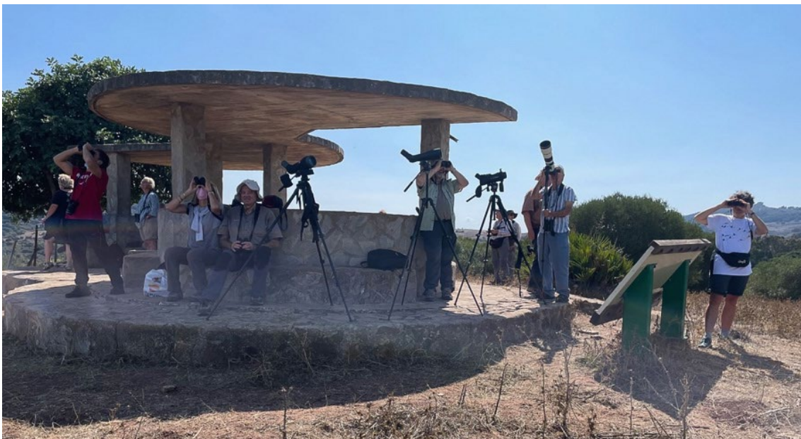
Grupo en el observatorio de El Algarrobo

Terminamos nuestro primer día de tour agotando las últimas horas en la Caleta de Tarifa donde algunos primeros limícolas como algunas decenas de vuelvepiedras y correlimos tridáctilo , se alimentaban a lo largo de la orilla sobre un manto de algas. A lo lejos, a cierta distancia, observamos varios alcatraces atlánticos , cormorán grande , algunas pardelas cenicientas y pardelas baleares , junto a varios charranes patinegros y un grupo de abejarucos europeos sobrevolaron nuestro punto de observación. Dimos por terminada nuestra primera jornada y nos desplazamos hasta nuestro alojamiento antes de ir a Tarifa para cenar.