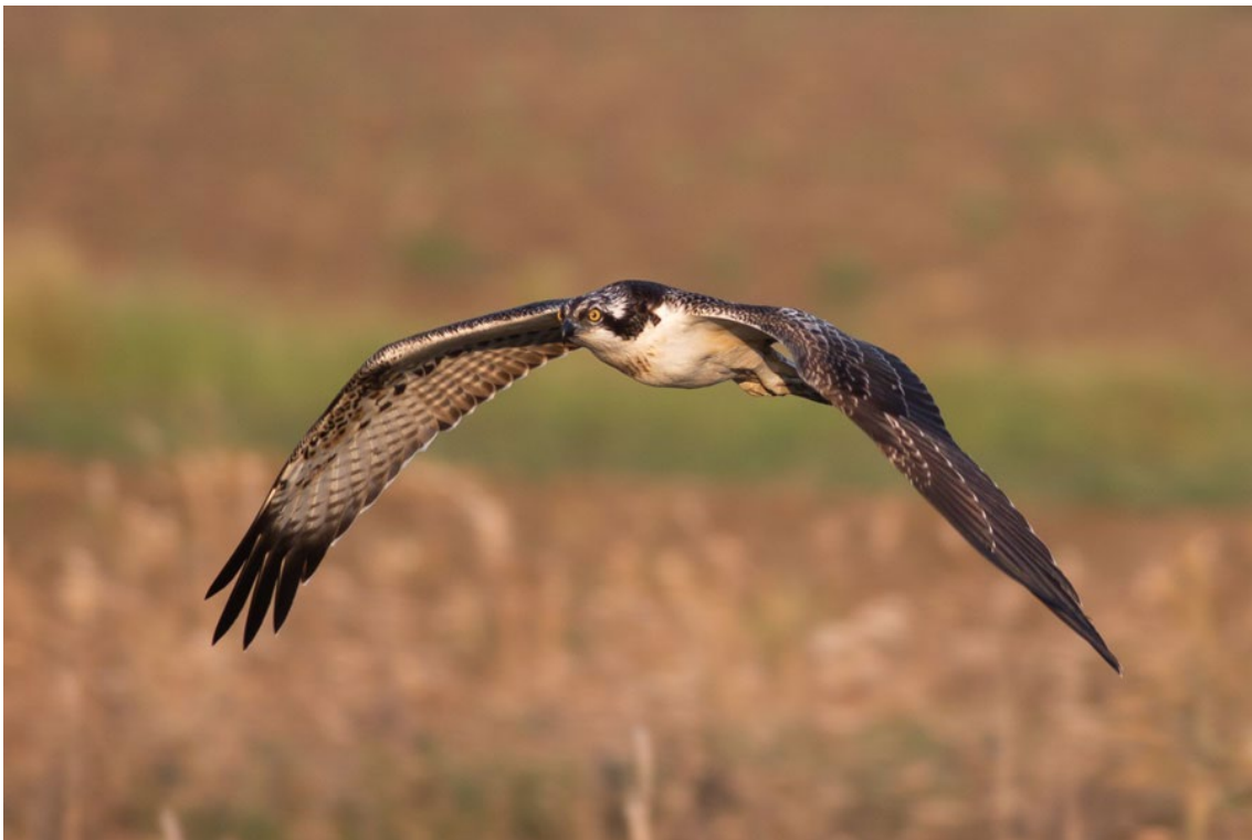
Aguila pescadora joven en La Janda

bueyeras, perdices rojas, faisán vulgar, dos elanios comunes, cinco aguiluchos laguneros, águila pescadora, aguilucho cenizo, cernícalo primilla y por fin, la muy esperada águila imperial , que estaba siendo acechada por varios busardos ratoneros . Casi oscureciendo nos trasladamos hacia Tarifa para cenar y de nuevo regresar a La Janda, ya de noche, para buscar aves nocturnas donde escuchamos cárabo común y mochuelo común y conseguimos ver al menos dos chotacabras pardos a muy corta distancia.