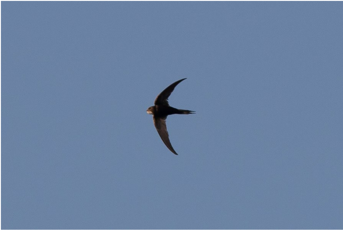
Vencejo Cafre en la autovía A381