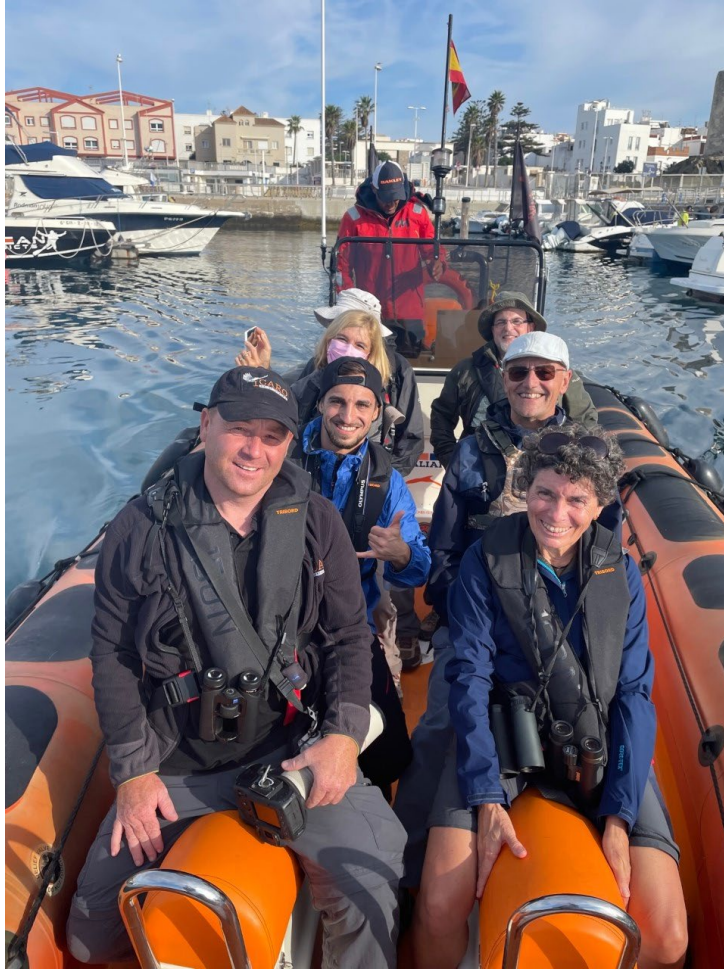
Grupo al completo antes de embarcarnos

Pero nuestro día aún no había terminado y una vez recuperados de las grandes emociones marinas, nos dirigimos hacia la Janda para pasar el resto de la tarde prospectando todas sus zonas. Las áreas y campos abiertos junto al Parque Natural de los Alcornocales son realmente muy productivos a la hora de encontrar rapaces y otras aves. Hasta un total de cuatro cigüeñas negras , grupos de al menos 200 cigüeñas blancas , hasta cuatro elanos comunes , un aguilucho pálido , un aguilucho cenizo , varios aguiluchos laguneros , al menos dos culebreras europeas , grandes grupos de buitres leonados , un cernícalo primilla y varios cernícalos comunes , busardo ratonero y un 'gibraltar' buzzard (busardo ratonero x busardo moro) posado a cierta distancia