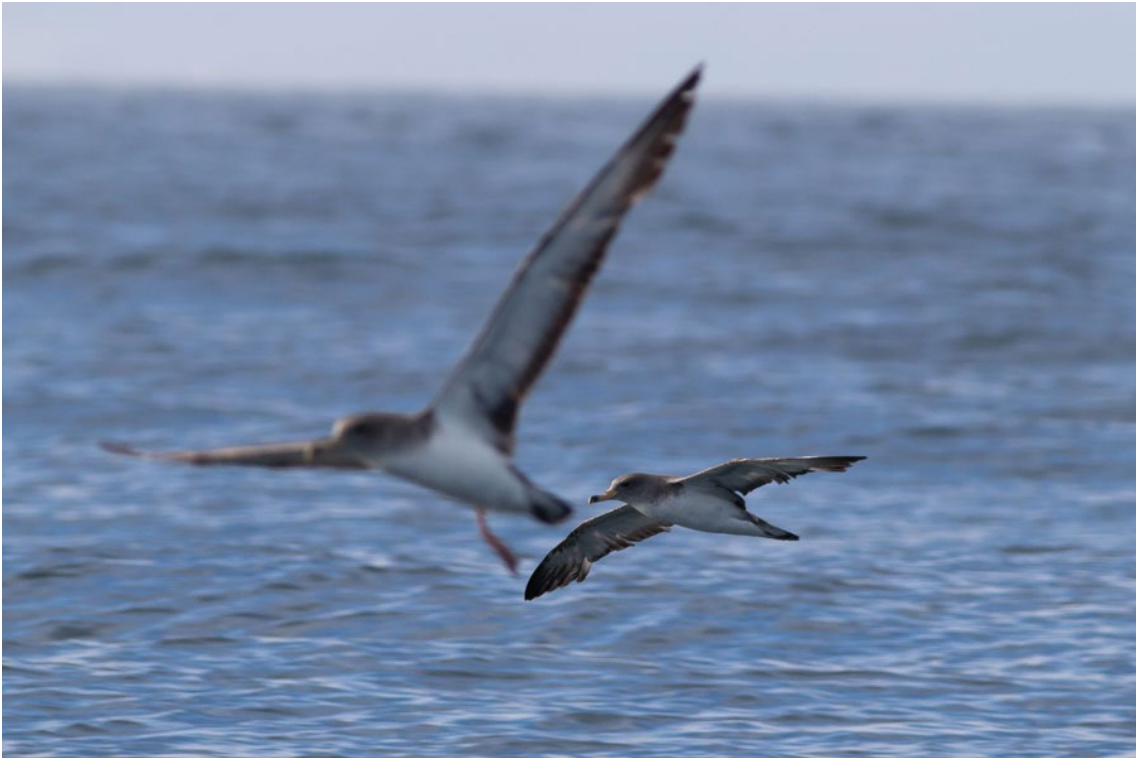
Pardelas Cenicientas frente a Tarifa