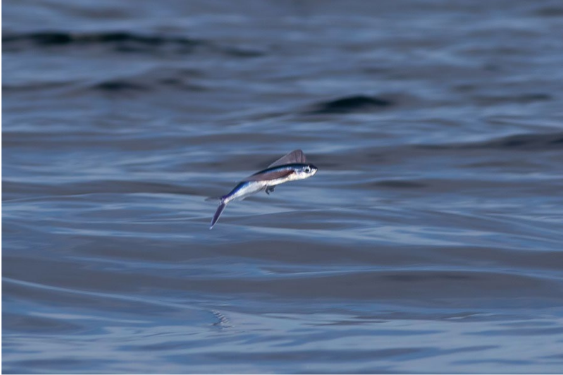
Pez volador durante la salida pelágica