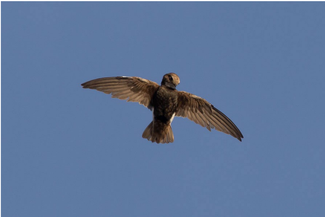
Vencejo Moro en Chipiona