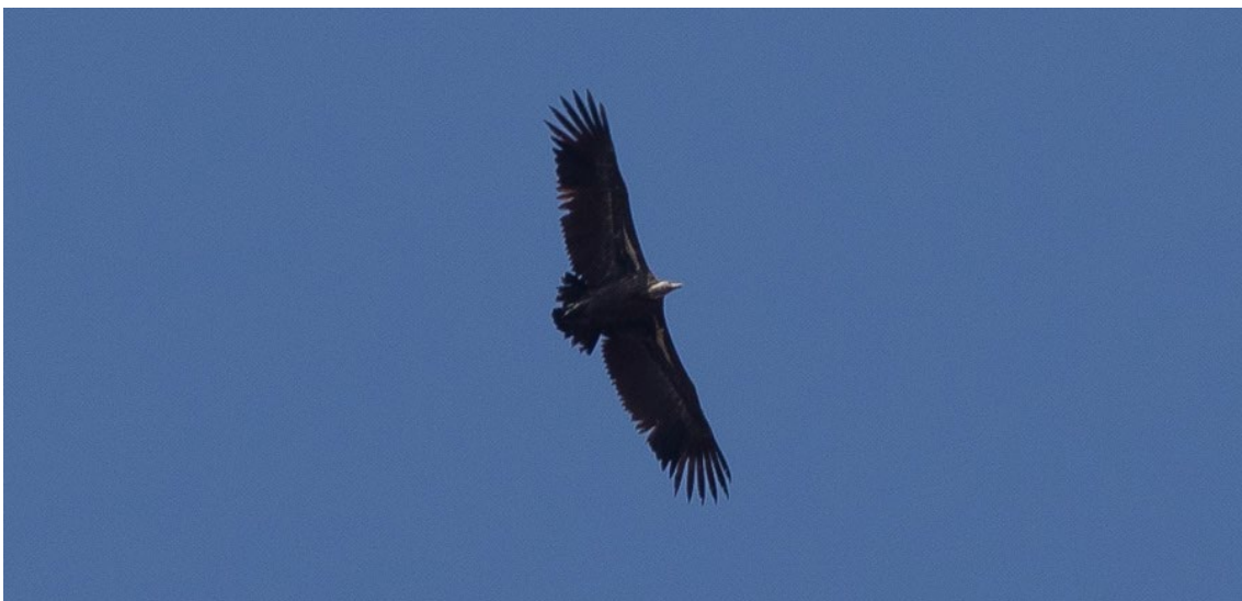
Buitre Moteado sobre El Algarrobo