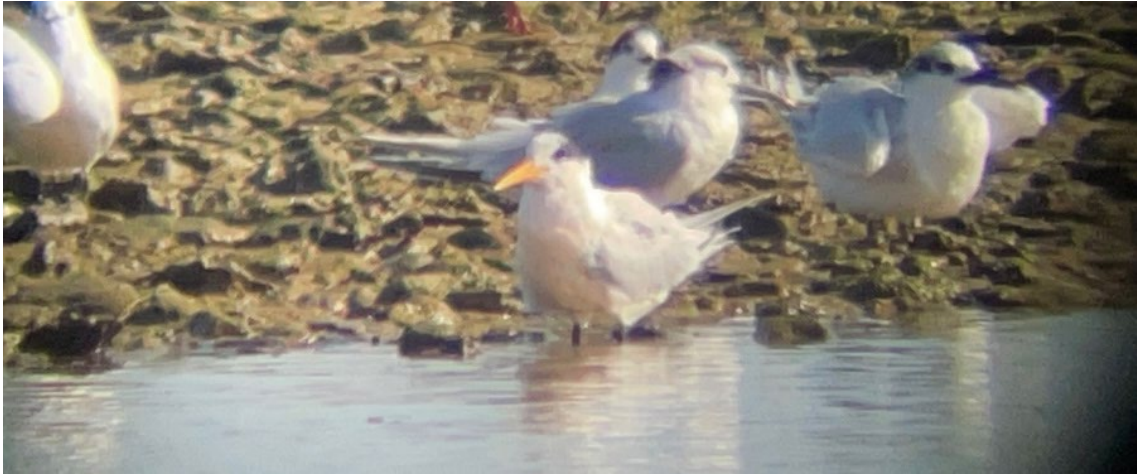
Charrán Elegante en Montijo